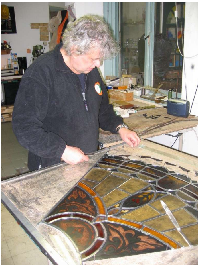
afbeelding 4: de glazenier met een van de trapeziumvormige delen van het venster