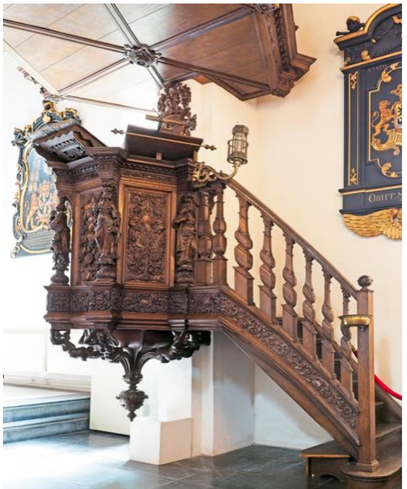
Een topstuk van Allert Meijer en Jan de Rijk, die de preekstoel in de lutherse kerk vervaardigden, is ook de preekstoel, die ze samen met Mencke Molaen maakten in de kerk te Midwolde.